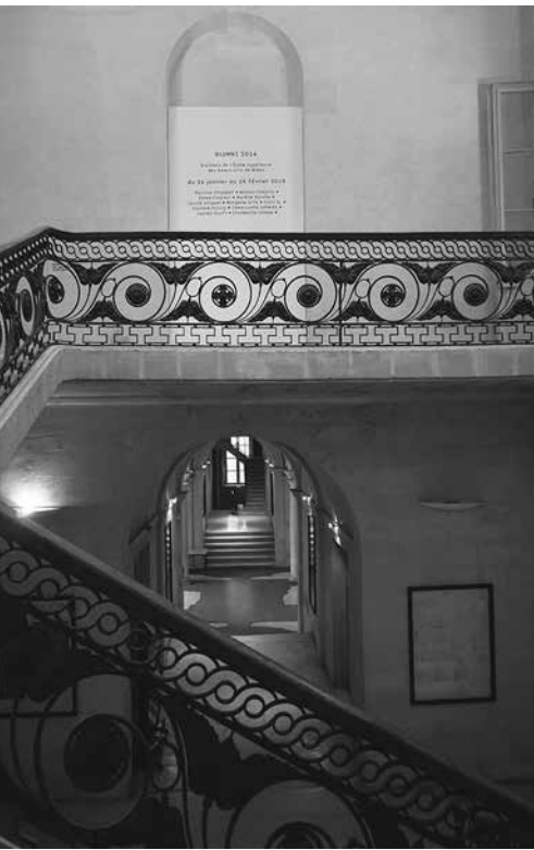
Vue de l'École supérieure des beaux-arts de Nîmes