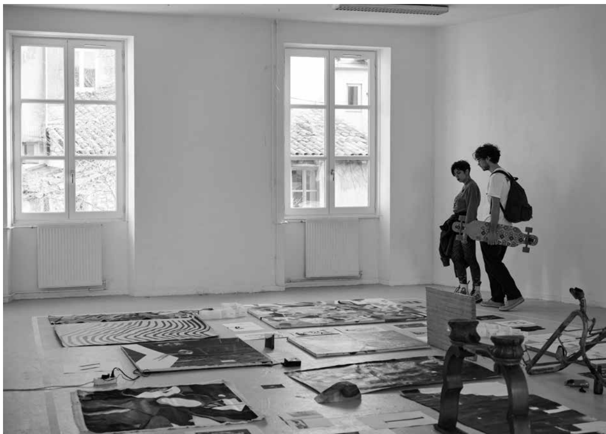
Exposition des étudiants de 1 re année dans le cadre de la Journée portes ouvertes 2019

En cas de redoublement, les crédits d'enseignements obtenus sont acquis et conservés l'année suivante cependant une présence assidue et active lors des enseignements est impérative.