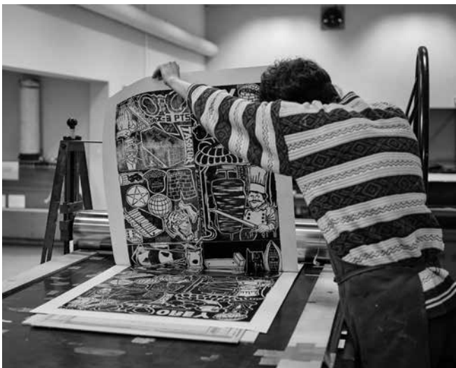
Atelier «Édition», site des Oliviers de l'Ésban

Le supplément au diplôme est délivré depuis l'année 2014 en même temps que le diplôme. Il a pour objectif de donner une lisibilité claire du parcours et des acquis de l'étudiant, à un niveau international. Il récapitule les enseignements suivis et crédits obtenus en 2 nd cycle, les expériences de mobilité et de stage de l'étudiant. Il informe sur les objectifs pédagogiques du cursus et les modes d'évaluation de l'établissement.