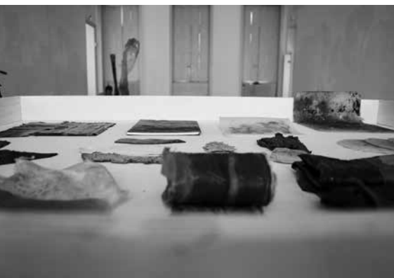
Travaux d'étudiant présentés dans le cadre de la soutenance du DNSEP, 2019