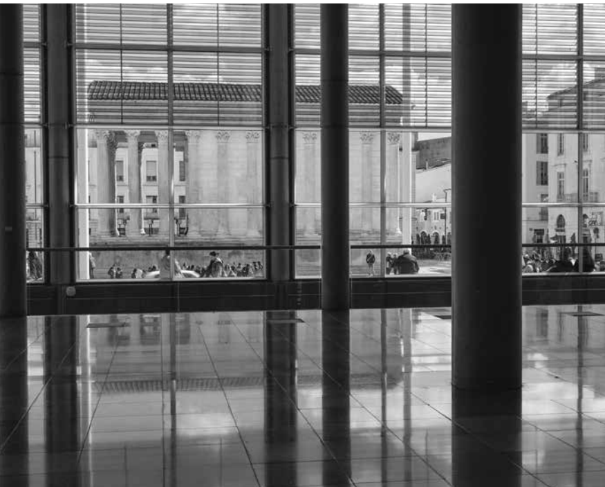
Vue de la Maison Carrée depuis Carré d'Art – musée d'art contemporain de Nîmes

Réseau des médiathèques de Nîmes: bibliotheque.nimes.fr