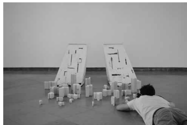
Préparation d'une soutenance de DNSEP, 2019

Les étudiants en séjour Erasmus au semestre 3 ou 4 ou au semestre 7 ou 8 sont fortement incités à réaliser leur stage dans le cadre de leur séjour à l'étranger.