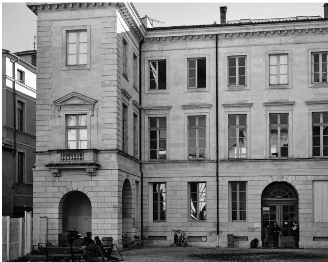
Vue de l'École supérieure des beaux-arts de Nîmes

Le site des Oliviers héberge l'atelier volume et l'atelier de pratiques éditoriales.