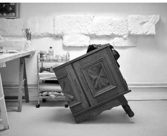
Atelier © Myr Muratet / Ésban

Les étudiants intéressés pour passer une période de leur cursus à l'étranger doivent obligatoirement consulter la rubrique International de notre site web, esbanimes.fr . Ils y trouveront plus d'informations sur les programmes et les modalités de participation.