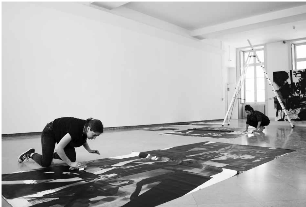
Préparation d'une soutenance de DNSEP, 2019

• les étudiants en situation de handicap voient leur temps de préparation et de présentation adapté sous réserve de l'analyse et de la préconisation de la CDAPH départementale. Ces derniers doivent adresser leur demande à l'un des médecins désignés par la commission des droits et de l'autonomie des personnes handicapées (CDAPH) et en informer l'établissement.