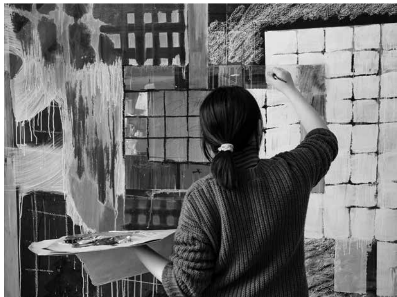
Workshop de l'Atelier Recherche Création Peinture