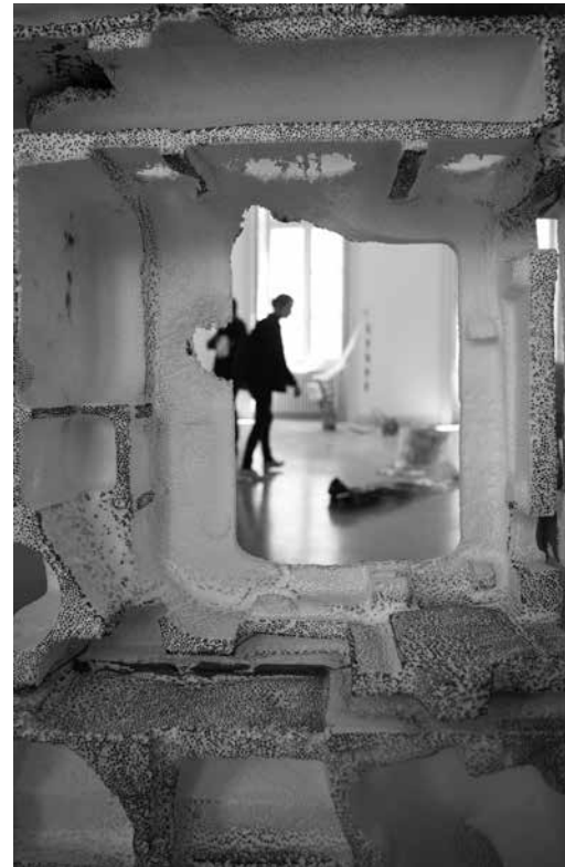
Exposition des diplômés 2019