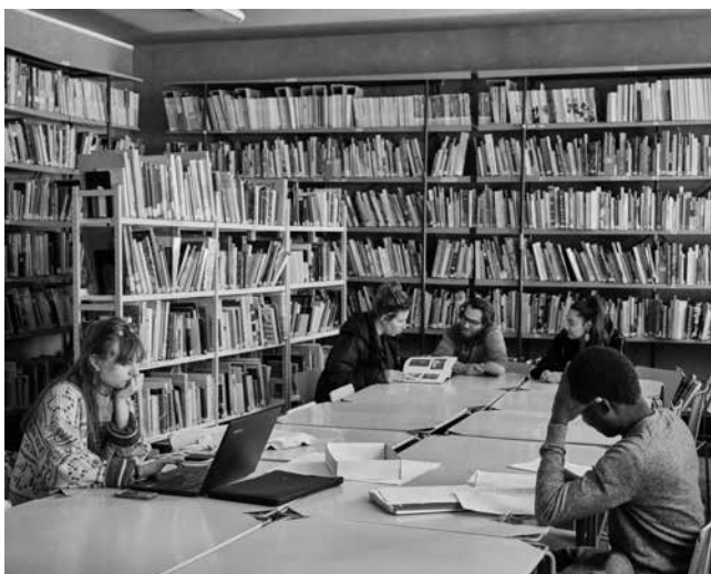
Bibliothèque de l'Ésban

La bibliothèque de l'école offre des collections diversifiées constituées en étroite collaboration avec l'équipe enseignante. Elles sont le reflet des enseignements dispensés par l'école et de son activité de recherche. Elles doivent en outre permettre aux étudiants de nourrir leurs réflexions personnelles et d'élargir leurs connaissances. 7800 livres, 220 titres de périodiques, et 900 vidéos : le fonds offre une place importante à l'art contemporain mais aussi à l'histoire de l'art et à la culture générale. La section la plus importante concerne les monographies d'artistes qui représentent à elles seules 30 % des titres.