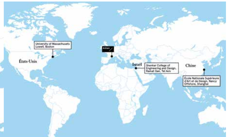
Les partenaires hors Europe